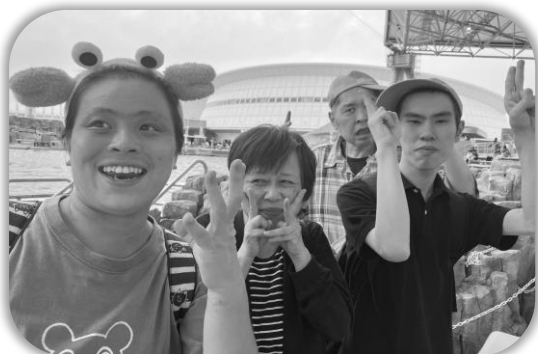
「名港水族館でイルカショーみたよ」

爽快に泳ぐイルカたちにうっとり♡♡ レゴランドのアトラクション：コーヒーカップで目が回っているよ～～🌀🌀🌀 社会見学では楽しく学習してきました✔