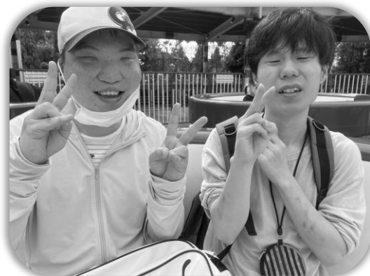
「レゴランドジャパ〜ン」

今回は名港水族館・レゴランド・明治乳業 & 下水道科学館見学の3コースから好きなコースを選んで出かけてきました。(O)